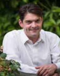
Jérôme VIAUD Maire de Grasse, Vice-président du conseil départemental des Alpes-Maritimes, Président de la Communauté d'Agglomération du Pays de Grasse.

Perpétré depuis des générations, le brûlage des résidus de jardins est ancré dans les habitudes, alors que sa pratique est strictement encadrée par la réglementation. Aujourd'hui, l'Agence Régionale de Santé dénonce les conséquences alarmantes de cette pratique sur la pollution de l'air et sur la santé humaine, tandis que la Préfecture alerte sur les risques d'incendies. Parce que toutes ces raisons en font une réelle préoccupation, et au vu d'un durcissement attendu de la Loi, j'invite les citoyens à une prise de conscience générale pour une évolution des comportements. Cette brochure vous permettra de découvrir comment mieux gérer les déchets issus de l'entretien de vos espaces verts à partir des alternatives légales existantes, adaptées à vos besoins et plus respectueuses de notre environnement. Pour une qualité de vie renforcée sur le Pays de Grasse, je compte sur votre totale implication pour amorcer ensemble cette mutation indispensable de vos usages.