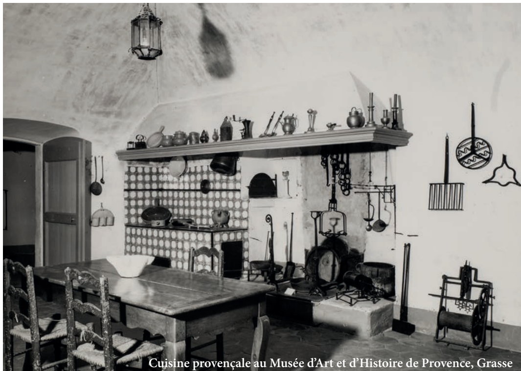
Cuisine provençale au Musée d'Art et d'Histoire de Provence, Grasse