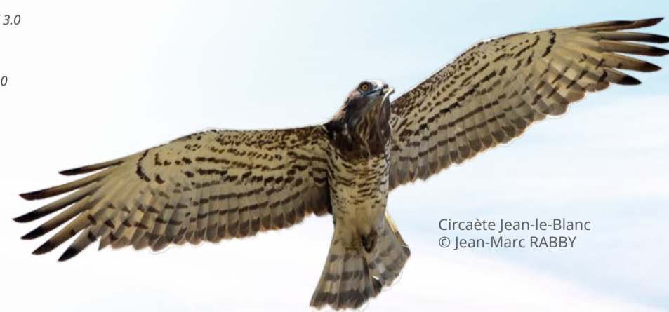
Circaète Jean-le-Blanc