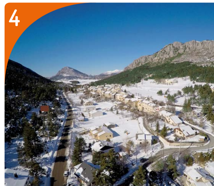
Plaine d'Andon

C'est ici que l'on retrouve les espèces typiques des milieux ouverts comme la Pie-grièche écorcheur, présente sur ce territoire de mai à novembre. Il n'est pas rare d'apercevoir sa silhouette sur un piquet de clôture. Les rapaces comme le Faucon crécerelle ou la Buse variable en font leur zone de chasse privilégiée, et la Caille des blés ou le Tarier pâtre nichent à proximité des prairies et des cultures.